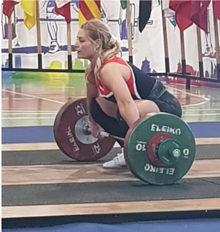
Tarima de competición (4x4m)