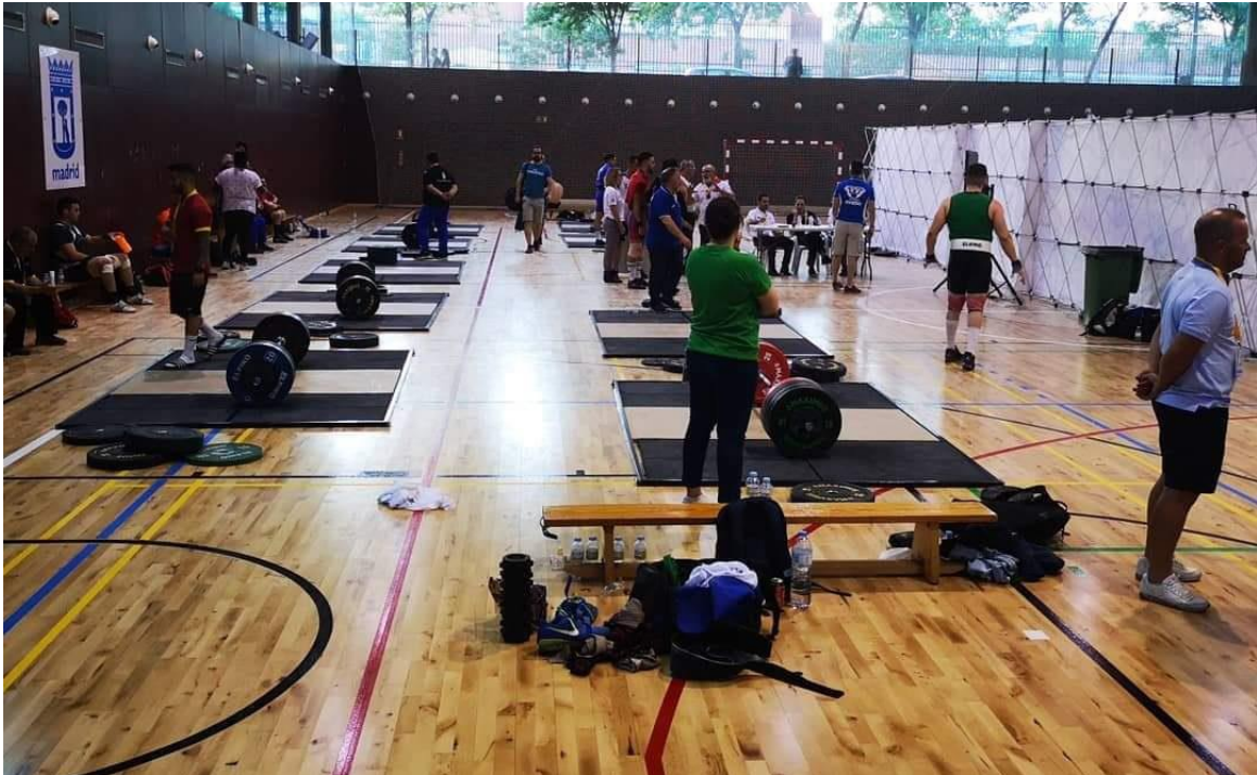
Sala de calentamiento (12 tarimas individuales)