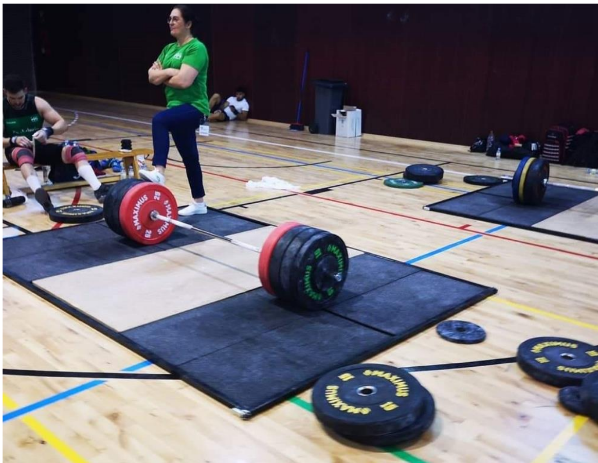
Tarima individual de calentamiento (2x2m)