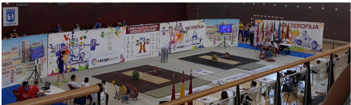
Montaje con 2 tarimas de competición (4x4m) con una separación mínima de 1 m